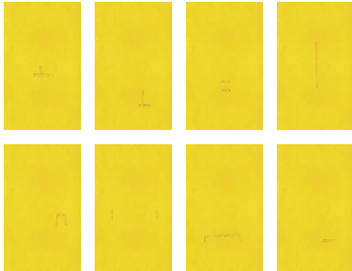
Серија 41, радови (слике) настали у периоду август, 2016-те године, кроз три подсерије: 41/21, 41/12 и 41/8. Наслов је заснован на броју серије и броју слика подсерије. Више о броју 41 1